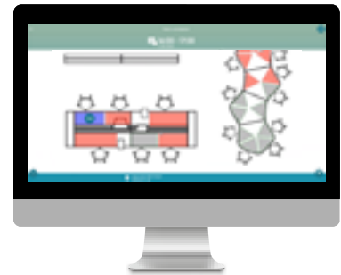
Plano con código de colores de las estaciones de trabajo reservadas, libres y no reservables (Prevención de la COVID-19)

Más información en: www.sedus.com/es/soluciones/seconnects/seconnects/